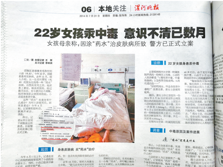
2014年7月31日,本报报道小洁汞中毒一事。本报记者 王辉 摄

本报讯(记者 王辉)“抓住了,批捕了,总算能给小洁一点安慰了!”1月15日,市公安局干河陈分局治安大队办案民警告诉记者,4年多前,卖给召陵区老窝镇女孩小洁(化名)“药水”并致其汞中毒、成了植物人的胡某某,落网了。