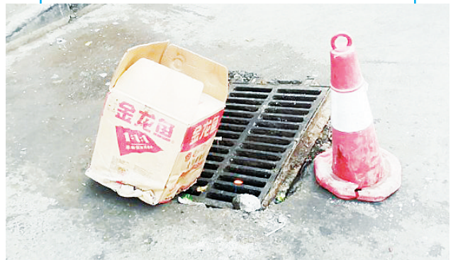
1月15日,市区受降路毓秀苑小区居民反映,小区大门口附近的一个窨井盖松动,存在安全隐患。老街办事处工作人员到现场查看后,放置了警示标识,并联系相关部门维修。