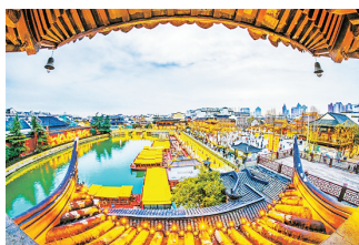
流光溢彩的秦淮河。

以华东为首的江南地区，有着独特的春节民俗，如金陵元宵节是南京最有名的春节民俗文化活动，从春节到元宵节，可持续50多天，金陵灯会有“秦淮灯彩甲天下”的美誉，为国家级非物质文化遗产，春节结伴赏灯是当地百姓必不可少的春节赏玩项目；苏州寒山寺的除夕敲钟始于1979年，其新年庆祝活动被称为中国最早、最大的旅游节，一边听钟祈福，一边可欣赏龙灯、舞狮、高跷、湖舟、轿子等传统民间表演；上海豫园、城隍庙的元宵节，也展现着江南传统的春节民俗。