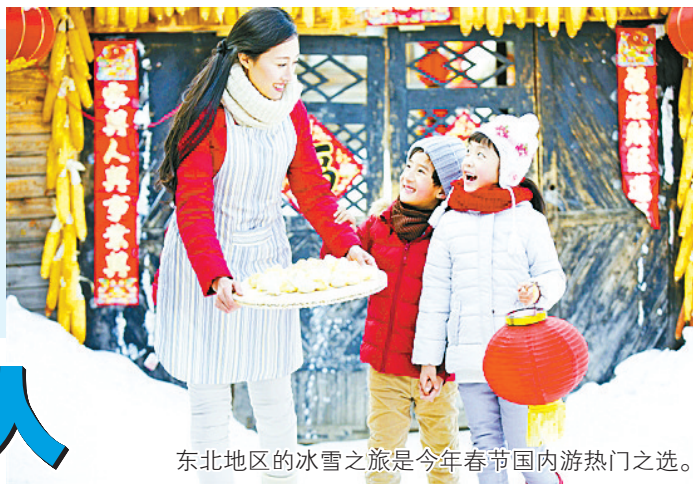
东北地区的冰雪之旅是今年春节国内游热门之选。

我国地大物博，华夏文明历史悠久，说起春节习俗，不同的地方各出奇彩，如同一幅加长版的历史画卷。利用春节出游的机会，感受各地不同的年俗，包括一些当季特别的节目和传统庙会，将是额外的收获。