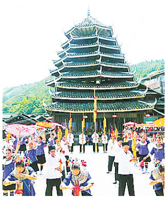
到广西过一个侗族风情春节。

舞龙舞狮拜年是桂柳人喜爱的传统项目，每到春节，舞龙舞狮队将龙和狮子装扮一新，苦练花式传统套路，图个喜庆。而在桂林的靖江王府还将上演新春纳福的好戏，期间，靖江王府有“福、禄、寿”三星报喜，可前往祈福，保佑来年顺利平安，还可参与趣味五福拓印等新春活动，把满满的福气带回家。