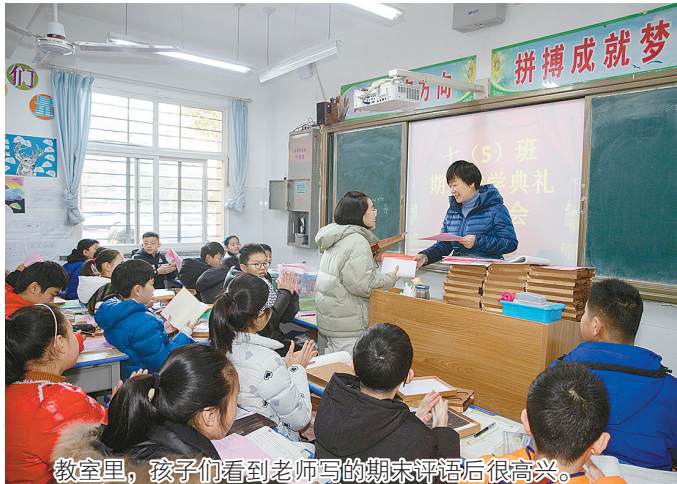
教室里,孩子们看到老师写的期末评语后很高兴。