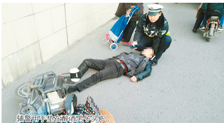
辅警用手垫在醉酒男子头下。