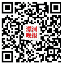
漯河晚报微信公众号

谷女士觉得,通过这些寒假作业,能看到学校和老师育人的智慧和能力。“能在学校和老师的带动下,让孩子学会生活和学习,这非常棒。我女儿也对老师布置的这些作业很感兴趣,今天一回家就开始做起来。”谷女士说。