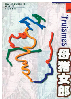
《母猪女郎》 【法】玛丽·达利耶塞克 著

《一只特立独行的猪》是王小波的一本杂文集，描写了作者对工作、生活、写作、社会的看法，幽默有趣，表达方式大多运用反讽。