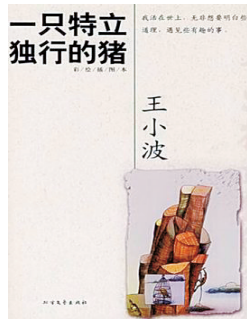
《一只特立独行的猪》 王小波 著

《一只特立独行的猪》是王小波的一本杂文集，描写了作者对工作、生活、写作、社会的看法，幽默有趣，表达方式大多运用反讽。