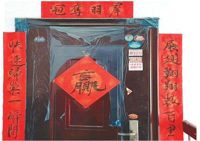
郭先生家贴的个性春联。