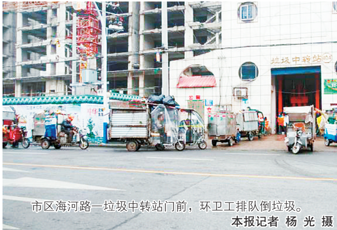
市区海河路一垃圾中转站门前,环卫工排队倒垃圾。

本报讯(记者 杨光 实习生 李潘)2月2日早上,不少市民向记者反映,市区不少垃圾中转站门前,环卫工推着垃圾车排起了长队,生活垃圾清运好像出现了堆积的情况。