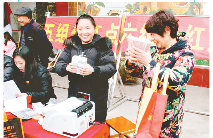
2月2日上午,在源汇区干河陈乡崔村村委大院,村民们领到了村集体经济的分红款后,人人脸上洋溢着幸福的笑容。