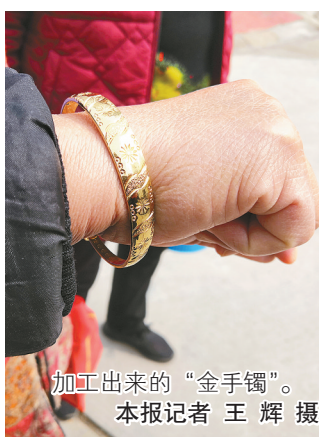
加工出来的“金手镯”。

在民警的询问下,这一男一女说出了实情,原来他们加工出来的首饰不是纯金,是黄铜的,他们只是想赚点加工费。