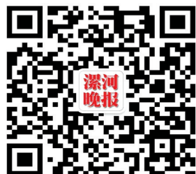
漯河晚报微信公众号

读他的文字，就像躺卧在油菜花盛开的田野里，嗅着夹杂着泥土气息的淡淡花香，你可以想象到收获季节的那种夯实与厚重。