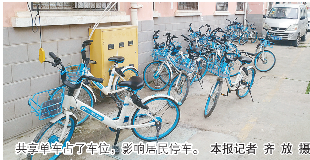
共享单车占了车位，影响居民停车。

本报讯（记者 齐放 实习生 李博昊）共享单车方便了许多市民的出行，但是，近日有市民反映，小区里共享单车乱停乱放，影响居民汽车停放。