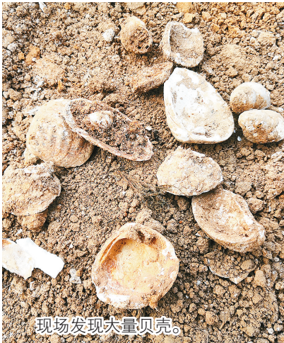
现场发现大量贝壳。