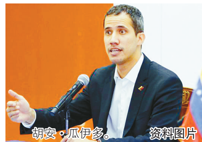
胡安·瓜伊多。