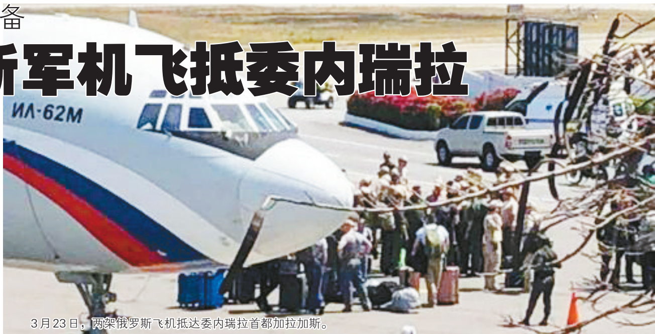
3月23日，两架俄罗斯飞机抵达委内瑞拉首都加拉加斯。

委内瑞拉今年以来陷入政治危机，俄罗斯反对军事干预，支持马杜罗政府与反对派对话。不过，俄罗斯外交官说，俄军最新举动旨在履行俄方先前与这个南美洲国家签署的军事技术协议，没有“神秘之处”。