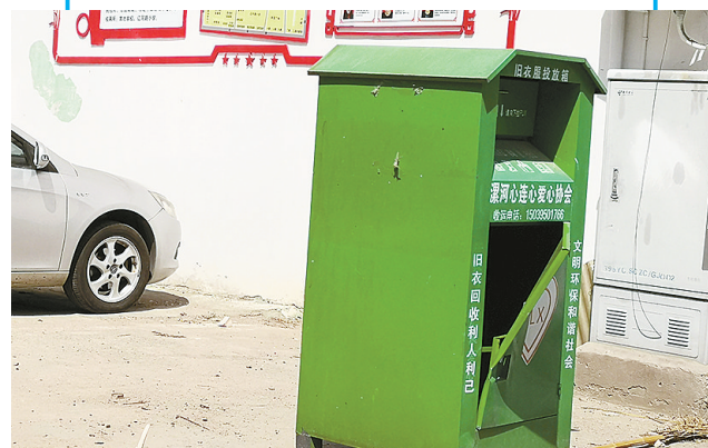
昨日，在市区辽河路东段，一个旧衣回收箱因受损张着“口”。