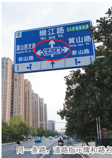
同一条路，道路指示牌和路名牌标注不一样。

4月16日上午，记者从新闻大厦沿嵩山东支路向北。在距离会展中心北侧道路20多米远处，道路上方悬挂的道路指示牌显示，前方东西方向的道路为“牡丹江路”。记者进入“牡丹江路”后，从市检察院向西，一直到祁山路，看到这条东西走向道路的路口处，路名牌上标注的都是“会展路”。