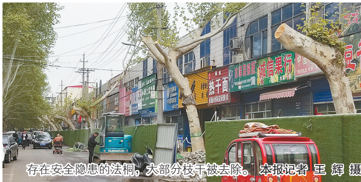
存在安全隐患的法桐，大部分枝干被去除。本报记者 王辉 摄

4月15日，记者在八一路看到，之前路北几棵树干严重倾斜的树，经过“抹头”修剪后，大部分枝干被去除，有的树木只剩下树干，用来支撑树干的钢管也被撤走。“这些法桐由于树冠倾斜严重，树干已经支撑不住树