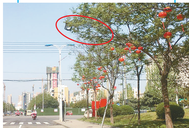
4月16日，在市区汾河北侧，因灯杆倾斜，减速慢行信号灯“躲进”绿化树枝叶中，过往司机根本看不到信号灯。