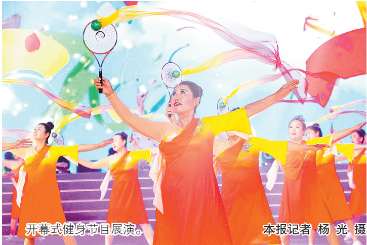
开幕式健身节目展演。

记者了解到，参与展演的大部分人员是老年健身爱好者。他们表演的“飞天锣鼓”、柔力球、健身球操、太极拳和传统武术等健身项目，体现了“我运动、我健身、我快乐”的理念，展示了老年人的热情与乐观向上的心态。河南省第十三届老年人体育健身大会由河南省体育局等单位共同主办，将持续到今年