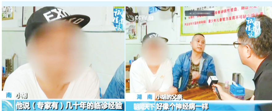
南 小胡 他说(专家有)几十年的临床经验

记者追踪调查发现,该犯罪团伙把普通民营医院包装成拥有“名医”的“三甲医院”,通过搜索竞价排名寻找病患对象,再雇用没有行医资质的“医生”诱导其接受高收费治疗,甚至开出许多对病情毫无作用的药物,从而达到敛财的目的。