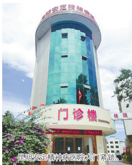
昆明安定精神病医院大门紧锁。

“热心”跟踪。如果患者在约定时间没来看病,医院科室会主动联系,“热心”跟踪未就诊原因。当患者就诊