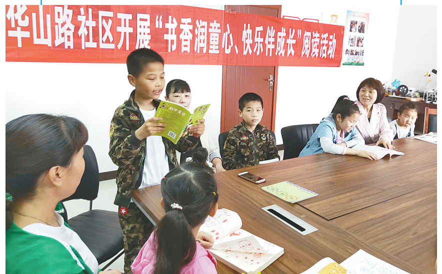
5月17日，郾城区龙塔街道华山路社区组织居民开展了“书香润童心 好书伴成长”亲子读书活动。