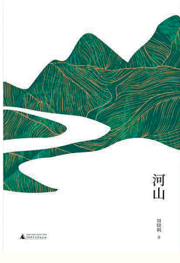
《河山》 作者:周晓枫 出版社:广西师范大学出版社

一次小小的酬神聚餐，引发了朝局的轩然大波，背景是北宋中期的庆历新政。作品展示了从宫廷到市井广阔的生活面，政治、社会、军事、外交，错综复杂；变革、权争、阴谋、人祸，惊心动魄。一波三折的朝廷新政被置于日常性的生活描画之中，既有细密精微的人情洞察，又有对于天下大势纵横捭阖的宏观把握。