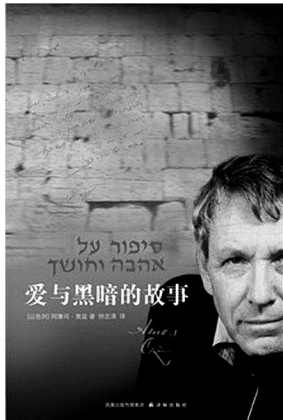
阿摩司·奥兹 著 钟志清 译 译林出版社

我在楼房最底层一套狭小低矮的居室里出生，长大。父母睡沙发床，晚上拉开的床从墙这头摊到墙那头，几乎占满了他们的整个房间。早上起来，他们总是把床上用品藏进下面床屉里，把床垫翻过来，折拢，用浅灰床罩罩得严严实实，上面放几个绣花靠垫，夜间睡觉的所有痕迹于是荡然无存。他们就是这样把自己的房间用作卧室、书房、阅读间、餐厅和客厅。对面是我的小绿屋，一个大肚子的衣橱占去了房间的一半。过道昏暗，狭仄而低矮，有点弯曲，像监狱里的逃跑地道，将两个小房间之间的简易厨房和厕所连接起来。囚禁在铁笼里的一只光线暗淡的灯泡，即使白天也向走廊投射出阴郁的微光。两个房间的前部都只有一扇窗子，窗子由金属遮