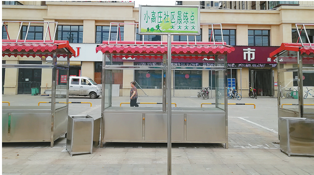
摆在路边的夜市摊。

本报讯（文/图 记者 李林润）“夜市搬迁了吗？”“夜市摊咋都摆到小区门口了？”6月19日上午，有居民在广天颐城小区微信群里提出自己的疑惑。