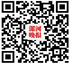
漯河晚报微信公众号

桥梁记录了一座城市的发展轨迹，见证了一座城市的繁荣与变化。漯河的“桥文化”，是改革开放的成果见证，成就突出，发展速度迅猛，已创出多个中原之最，桥已成为漯河的标志和特色。