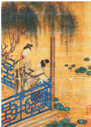
苏汉臣《荷塘消暑图》

河岸、池塘边也是古人乘凉的好去处。宋代宫廷画家苏汉臣的《荷塘消暑图》就描绘了在荷塘边纳凉的美女。画中的荷塘碧水涟漪,荷叶田田;岸边垂柳依依,枝条拂弄水面,景色宜人。两位仕女衣着素雅,凭栏观荷,一阵轻风拂过水面,顿时变得十分凉爽,并且伴着荷