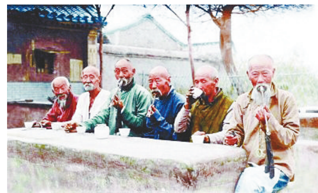
上色前后的照片对比。

通过技术手段将过去的场景复原,可以让历史与现实进行更好的连接,让年轻一代更真切地触摸到历史。