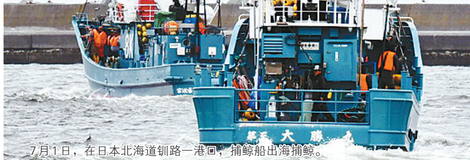
7月1日，在日本北海道钏路一港口，捕鲸船出海捕鲸。