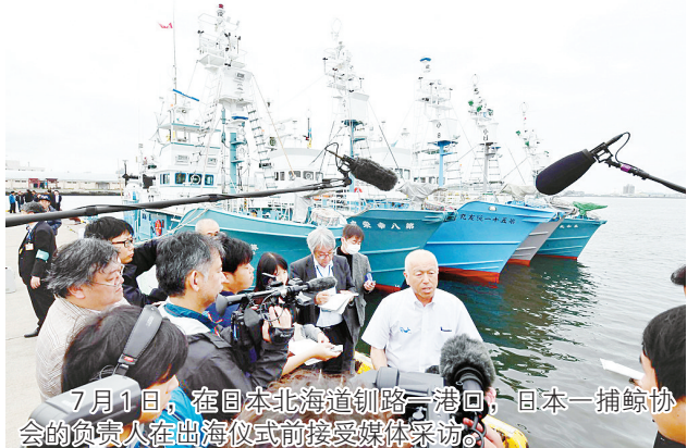
7月1日，在日本北海道钏路一港口，日本一捕鲸协会的负责人在出海仪式前接受媒体采访。