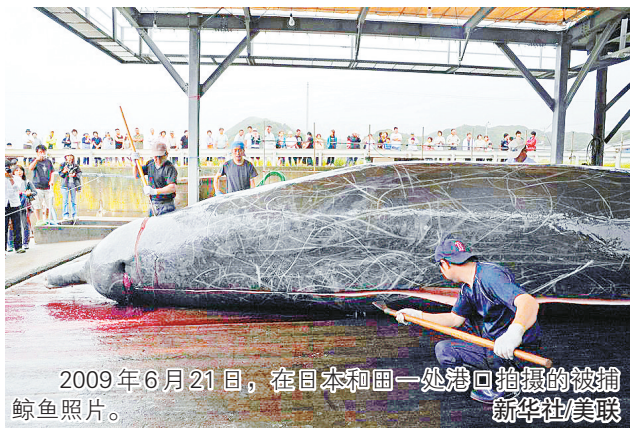
2009年6月21日，在日本和国一处港口拍摄的被捕鲸鱼照片。

日本捕鲸船队7月1日从多座港口起航，时隔31年重新启动商业捕鲸。前一天，日本正式退出禁止商业捕鲸的国际捕鲸委员会，继而实现这一“夙愿”。