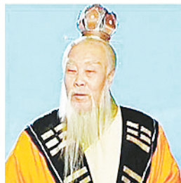
《西游记》中太上老君的头冠戴法错误。