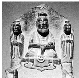
道教造像石,天尊头戴莲花冠。