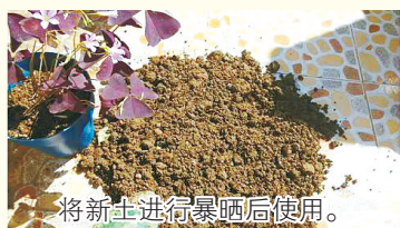
将新土进行暴晒后使用。