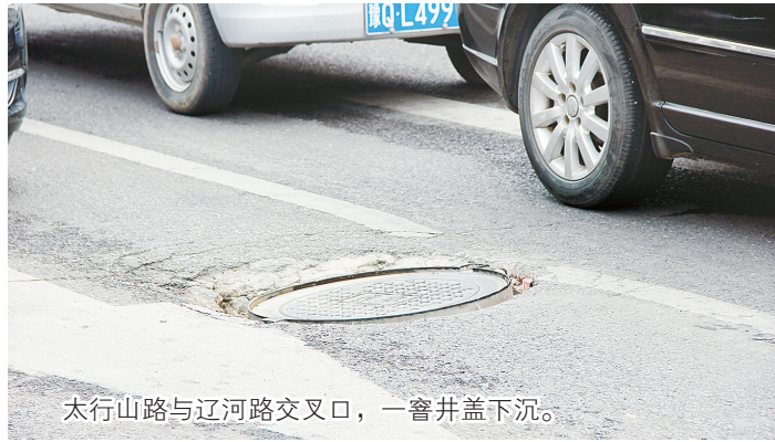
太行山路与辽河路交叉口，一窨井盖下沉。