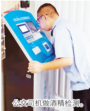
公交司机做酒精检测。

市公交集团表示，龙江路公交场站和高铁公交场站是试点，他们会收集司机们的意见和建议。这项安全管理新措施，预计2019年年底前在各个公交场站实行。