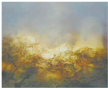
贺一珉的油画作品《殷墟晚照》。