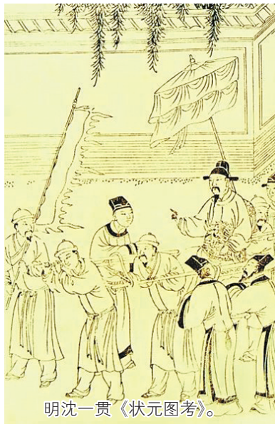
明沈一贯《状元图考》。