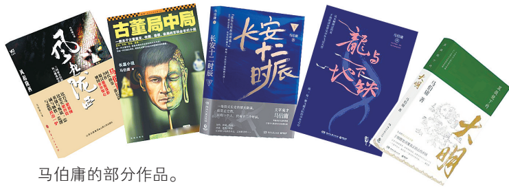
马伯庸的部分作品。

马伯庸的小说一向以知识点密集著称，这部《长安十二时辰》也不例外，书中对唐朝生活的还原备受好评，马伯庸自己也说，写《长安十二时辰》最大的挑战并不是故事编织和人物塑造，而是对那个时代生活细节的精准描摹。