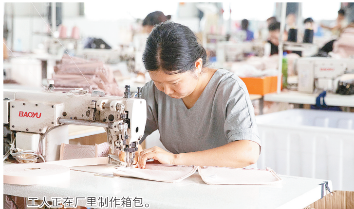
工人正在厂里制作箱包。