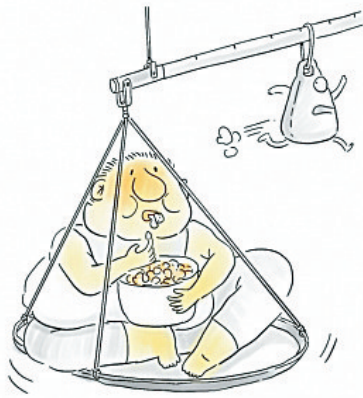
人在吃,秤在看。 仕成 绘