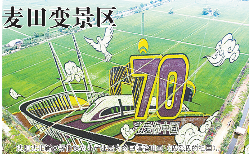
沈阳沈北新区锡伯族农业产业园内的巨幅稻田画《我爱我的祖国》。

但如今的“旅游热”,却让很多农家改变了这种传统的想法。将普通的农田改造,做出大幅的稻田画,竟也能吸引大批游客来欣赏,这的确让农家们尝到了甜头。传统观念一旦被改变,似乎也有些星星之火的意思,各种“中国风”稻田画或麦田画,这两年迅速在全国各地蔓延开来。作画内容已远不止是什么世界名画、卡通人物或者简单的几何图形,嫦娥、齐天大圣、微信红包……一些颇有中国特色的图案都出现在田间地头,成为盛