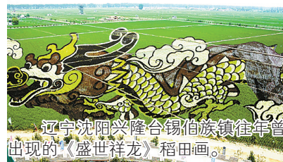
辽宁沈阳兴隆台锡伯族镇往年曾出现的《盛世祥龙》稻田画。