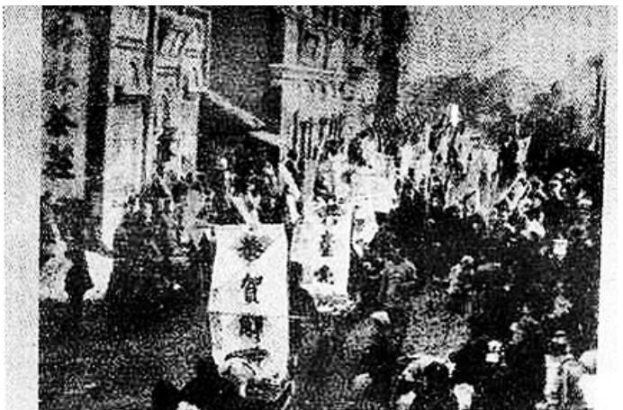
漯河人民欢庆解放。