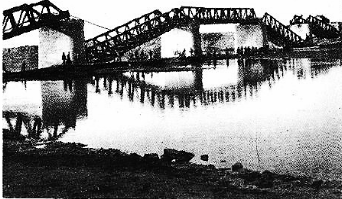
中国人民解放军四纵十旅破击平汉线破毁的漯河沙河铁路大桥。

漯河的解放使人民看到了光明和希望,郾城、西平一带70余村,农民1500多人,赶着900多辆大车,帮助解放军搬运缴获物资。很多知识青年和农民听闻号召参加解放军的消息后,欣喜若狂,奔走相告,纷纷要求参军,社会秩序很快得到恢复,各商号正常开业。