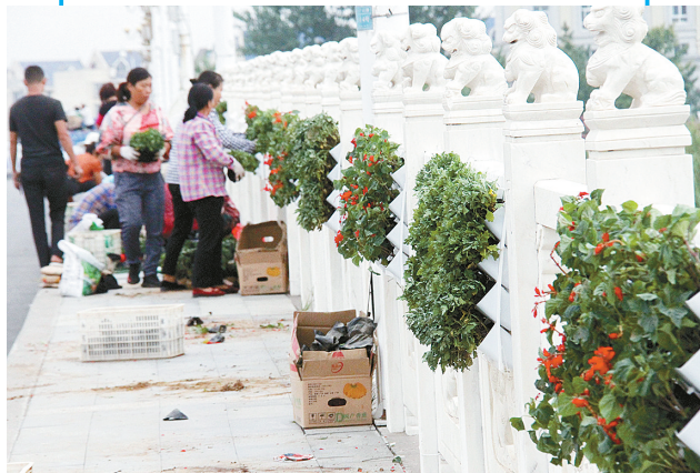
为庆祝新中国成立70周年，9月2日，市城市管理局组织人员用花卉装点太行山路澧河桥，美化城市环境。