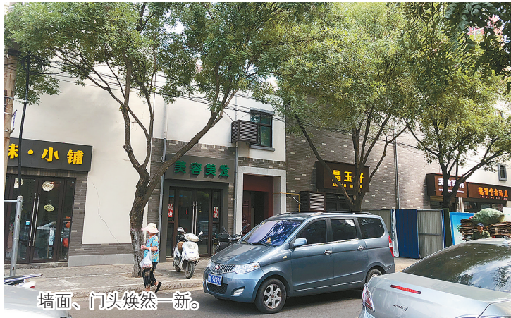
墙面、门头焕然一新。