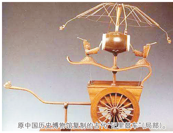
原中国历史博物馆复制的古代“记里鼓车”(局部)。