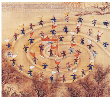
清朝冬季冰上阅兵活动。

明朝的阅兵,每年年终考阅一次,三年大阅一次,也称“小阅”和“大阅”。清朝大阅的制度更加完善,大阅的地点主要在南苑、卢沟桥、多伦诺尔(今内蒙古多伦)、畅春园等地。除了皇帝亲自阅兵外,还会钦派知兵大臣数员前往阅兵,阅兵内容有“军容、军技、军学、军器、军阵、军律、军垒各项”。