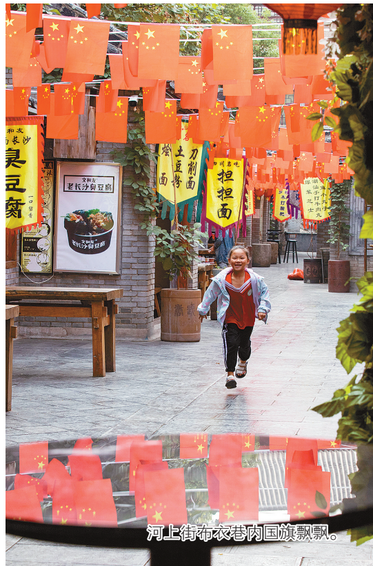
河上街布衣巷内国旗飘飘。