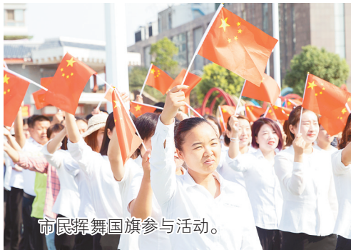
市民挥舞国旗参与活动。