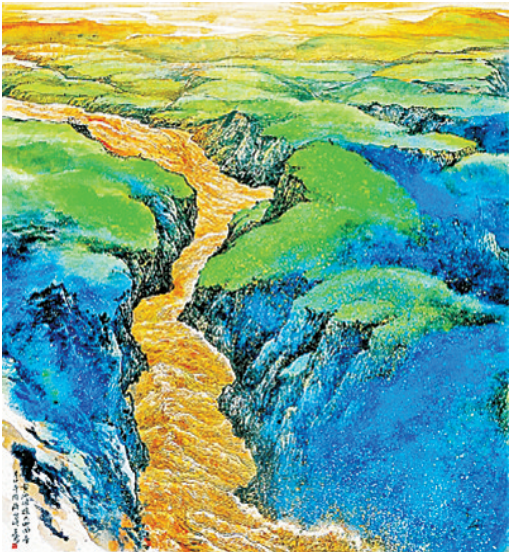
黄河涌进大地回春（中国画）万鼎作

黄河宁，天下平。“把黄河治理好，关键是要把泥沙管住，不能让它随心所欲地流进黄河。新中国成立后，科学家已经为治理黄河设计了方案。他们认为黄土高原地区应坚持