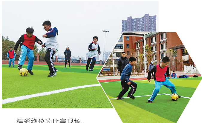
精彩绝伦的比赛现场。

比赛中,双方队员们本着“友谊第一,比赛第二”的体育理念,团结协作、奋力拼搏。奔跑、传球、射门等一个个娴熟的动作,展现了各校队精诚合作、顽强拼搏的体育精