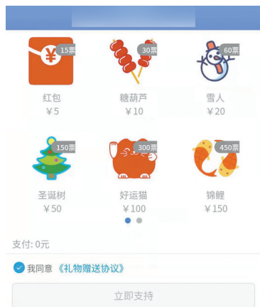
虚拟礼物价格及抵的票数。

记者看到,活动参与人数为84人,总投票数为48910票。其中,获得第一名的选手为7830票。点开前几名的“选