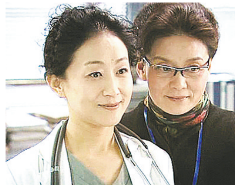
《医者仁心》(2010)重塑医疗行业形象。