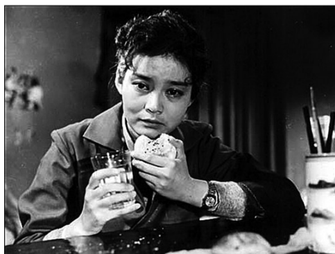
《人到中年》(1982)潘虹饰演陆文婷。

20世纪80年代，随着我国电视剧产业的发展，医疗剧也成为重要的题材类型。1987年，内地医疗剧的开山之作《希波克拉底誓言》播出，该剧细致刻画了三位医生竞争眼科主任的过程，反映了医护人员的心理变化，播出后广受好评，也为1995年的《妇产医院》和1999年的《儿科医生》提供了创作思路。这两部剧都对医德和伦理展开了探讨，而社会上日渐凸显的医患矛盾也在剧里露出苗头。