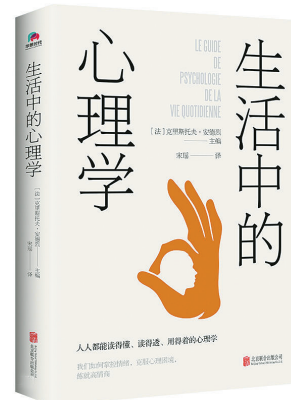
[法]克里斯托夫·安德烈 主编 北京联合出版公司

几乎所有心理学基础知识，在本书中都得到了清晰、透彻而精练的表述。全书图、文、表结合，含有丰富的实例、说明和建议，并包含大量的测试题——测试是人们发现自我的第一步，通过测试结果可以对自身的问题有更科学清晰的认识，然后更有针对性的解决问题。特殊时期如何对抗焦虑与恐慌，不妨学一点心理学提升自己、帮助他人。