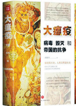
刘滴川 著 天地出版社

一部富有可读性的关于瘟疫的另类文明史。本书通过对秦汉历史的考察，揭示瘟疫对人类发展的影响与深刻意义。内容多元，包括古代记载、历史遗迹、地理沿革等，全方位展示瘟疫的文化故事和历史真相，是一本跨学科的历史读物。