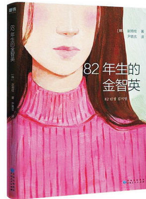
[韩]赵南柱 著 贵州人民出版社

在书中，金智英是那种你每天都会迎面遇到的普通女孩。从小，她就有很多困惑，感觉自己仿佛站在迷宫的中央，明明一直在脚踏实地地寻找出口，却发现怎么都走不到道路的尽头。 晚综