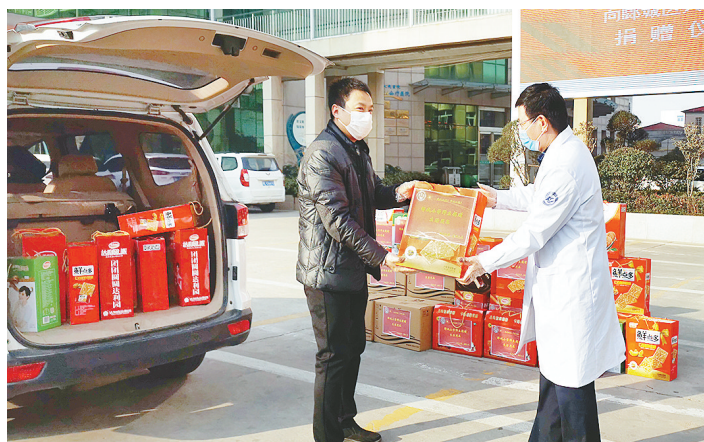
2月20日,郾城小学向郾城区人民医院捐赠一批食品、日用品等物资,价值1万余元。