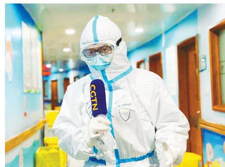
摄制组深入隔离病房采访。

为了拍摄,摄制组进入一家医院的隔离病房,但医院不允许将任何物品带入病房,包括摄像机。院长告诉摄制组,他自