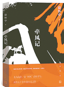
《牵风记》 徐怀中 著 人民文学出版社