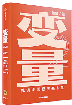
《变量：推演中国经济基本盘》 何帆 著 中信出版集团

读书使人明智,读书使人明理,读书使人眼界更广阔,读书使人内心更有力量。“爱读书、多读书、读好书”不仅滋养心灵,也能从书中获得待人处世的启发,迭代思维。对于工作和生活都是有益的补充。本期推荐几本不同方面的书籍。在这美好的春天,伴随着万物复苏的性灵,让我们一起沐浴在书香中,感受生命的力量和思维的成长。