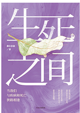
《生死之间——当我们与疾病和死亡狭路相逢》 偶尔治愈 著 中信出版社