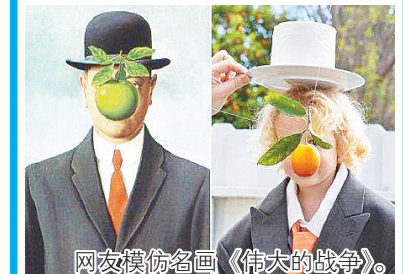
网友模仿名画《伟大的战争》。