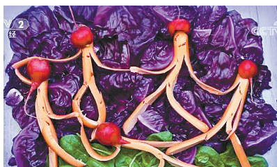
香肠+菠菜+萝卜构成了马蒂斯的名作《舞蹈》。