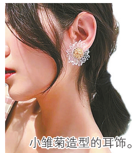
小雏菊造型的耳饰。

春天的主题就是花,单穿花朵图案的衣服,稍有不慎很容易踩雷。但是配饰就不一样了,将花朵配饰融入日常搭配中,最能体现春天的气息。