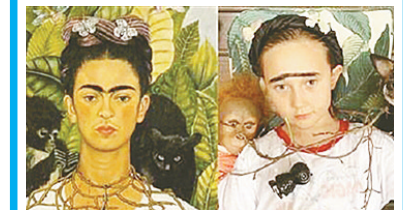
网友模仿名画《戴着荆棘项链与蜂雀的自画像》。