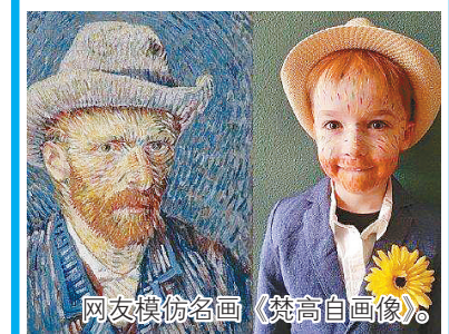
网友模仿名画《梵高自画像》。