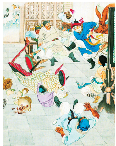
《西游记》中《大闹天宫》。