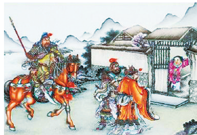
《三国演义》中《三顾茅庐》课本插画。