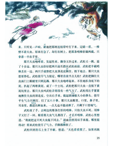
《水浒传》中《景阳冈》课本内页。

一代有一代的文学,明清有小说。明清小说与唐诗、宋词、元曲一样,是那个时代文学的代表。然而,无论明代还是清代,白话小说虽流行于市井之间,私藏在文人的书房之中,但就是难登大雅之堂。