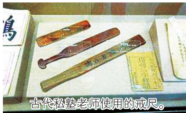
古代私塾老师使用的戒尺。

在识字、作文之余, 学生还要适当学习经、史、历、算等知识, 兼习当朝律令以及冠、婚、丧、祭等礼仪。除此之外, 古代小学课堂也会教学生音乐、射击等课程。