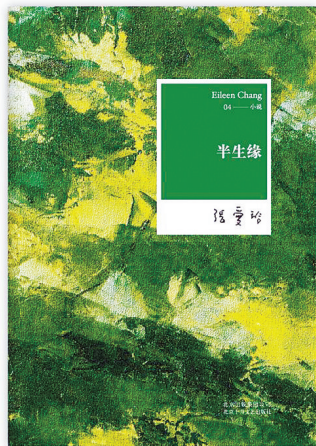
《半生缘》 张爱玲 著

顾曼桢与沈世钧的悲剧、顾曼璐的悲剧、石翠枝与许叔惠的悲剧、顾曼璐与张豫谨的悲剧等。多重悲剧的相互交叉、紧密联系，促进了故事情节的发展，使得整部作品结构紧凑，细腻完整地呈现在读者面前。书中的所有人物历经半生，饱经悲欢离合所获取的爱情都不尽如人意，他们或有情无爱，或有名无分、又或空有其名，与本书的主题“半生缘”十分吻合。