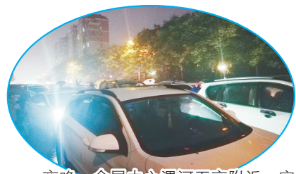
夜晚,会展中心漯河五高附近,家长接孩子时把车停在路中间。

今年是我市创建全国文明城市决战决胜年。漯河有这样一群“啄木鸟”,他们通过随手拍的形式曝光身边存在的不文明现象,推动问题尽快整改解决,为我市全国文明城市创建添砖加瓦。今日起,本报推出《我是创文啄木鸟》专栏,刊发热心市民的“随手拍”。