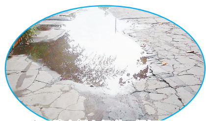
金江路南侧人行道,损坏严重。