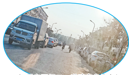
福星家园间回,道路变身停车场。