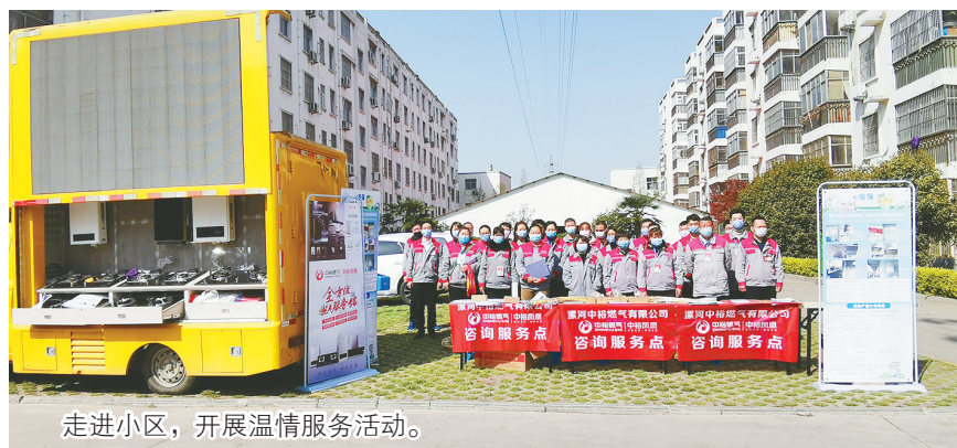
走进小区,开展温情服务活动。

活动中,燃气公司工作人员在社区设立服务咨询台、悬挂横幅、摆放易拉宝安全知识展板,并发放安全宣传彩页。工作人员一方面现场面对面解答用户问题,为用户提供燃气业务咨询,向用户普及燃气安全知识及操作规范,有效提高居民安全防范意识,确保用户安全用气;另一方面走