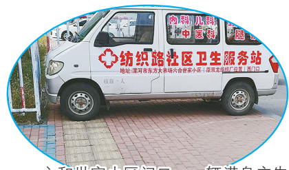
六和世家小区间回,一辆满身广告的面包车长时间占盲道。