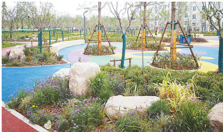
↑5月13日，市区嵩山路沙河桥南樱花园正式开放。