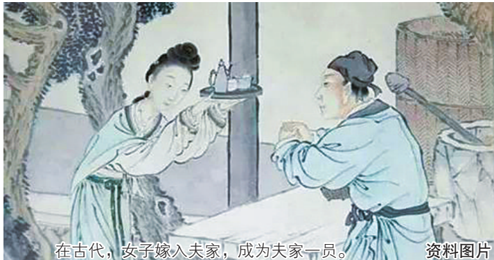
在古代,女子嫁入夫家,成为夫家一员。

那么,中国的姓氏是怎样起源的?为何在古代中国,女子会“从夫居从父姓”?“冠姓”是一种权利吗?