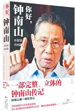
《你好，钟南山》 叶依 著 广东教育出版社

近日，记者获悉，由叶依所著，首本立体、完整的钟南山传记《你好，钟南山》出版。钟南山，到底是一个怎样的人？是什么力量让他承载了巨大的压力，毅然挑起千钧之重？从非典到新冠肺炎疫情，他经历了怎样的人生？从2003年“非典”期间的敢医敢言到