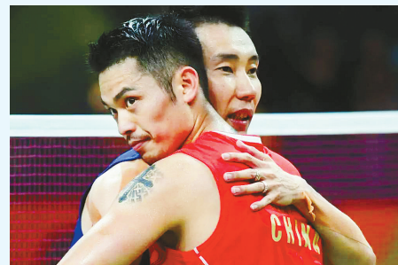
2016年8月,林丹和李宗伟在里约奥运会羽毛球男单半决赛后拥抱致意。

正如李宗伟所说,三缺一很久了,全部离开赛场的羽坛“四大天王”未来如何续写他们的故事? 晚综