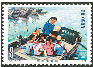
《乡村女教师》纪念邮票。

“教师封”。福建省邮政部门于1999年6月16日发行了教师节有奖明信片一套2枚：《辛勤园丁情，学子寸草心》和《春蚕如丝织，桃李满天下》，该片属国内首创教师节的有奖明信片。中国网