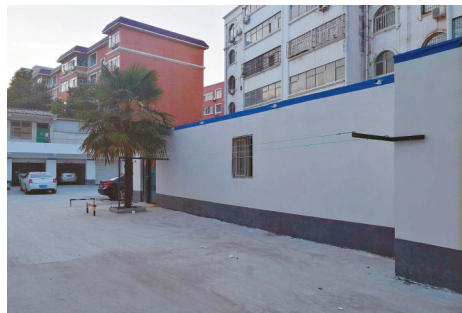
柳江路水景新苑小区墙面刚刚粉刷一新，有人在墙上安铁架子晾晒衣服。