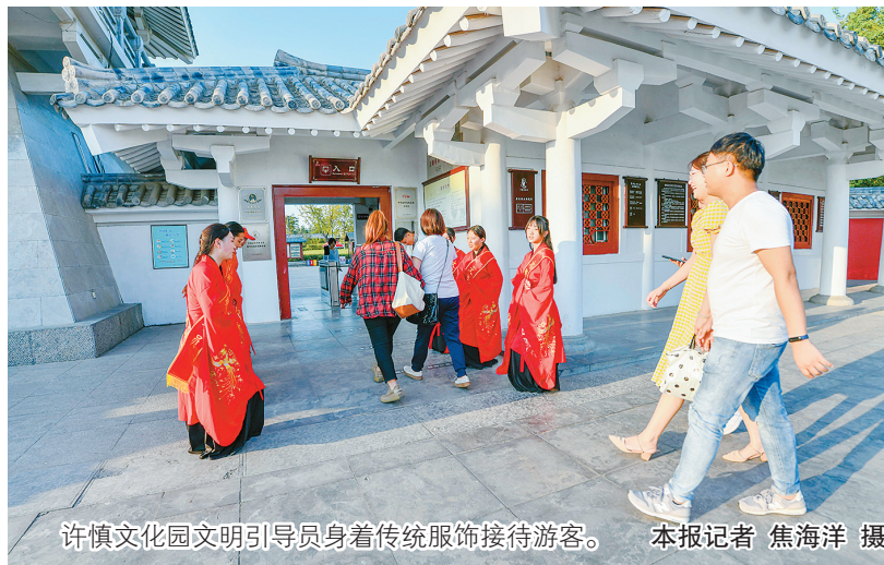
许慎文化园文明引导员身着传统服饰接待游客。