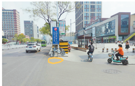
人民路与文化路交叉口，缺少非机动车引导牌。