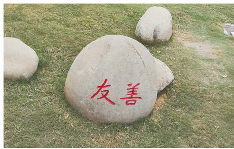
红枫广场沙滩东北角石刻“善”字有误。