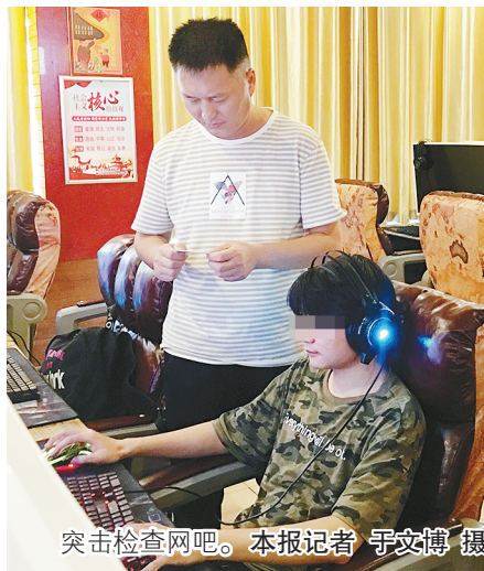
突击检查网吧。